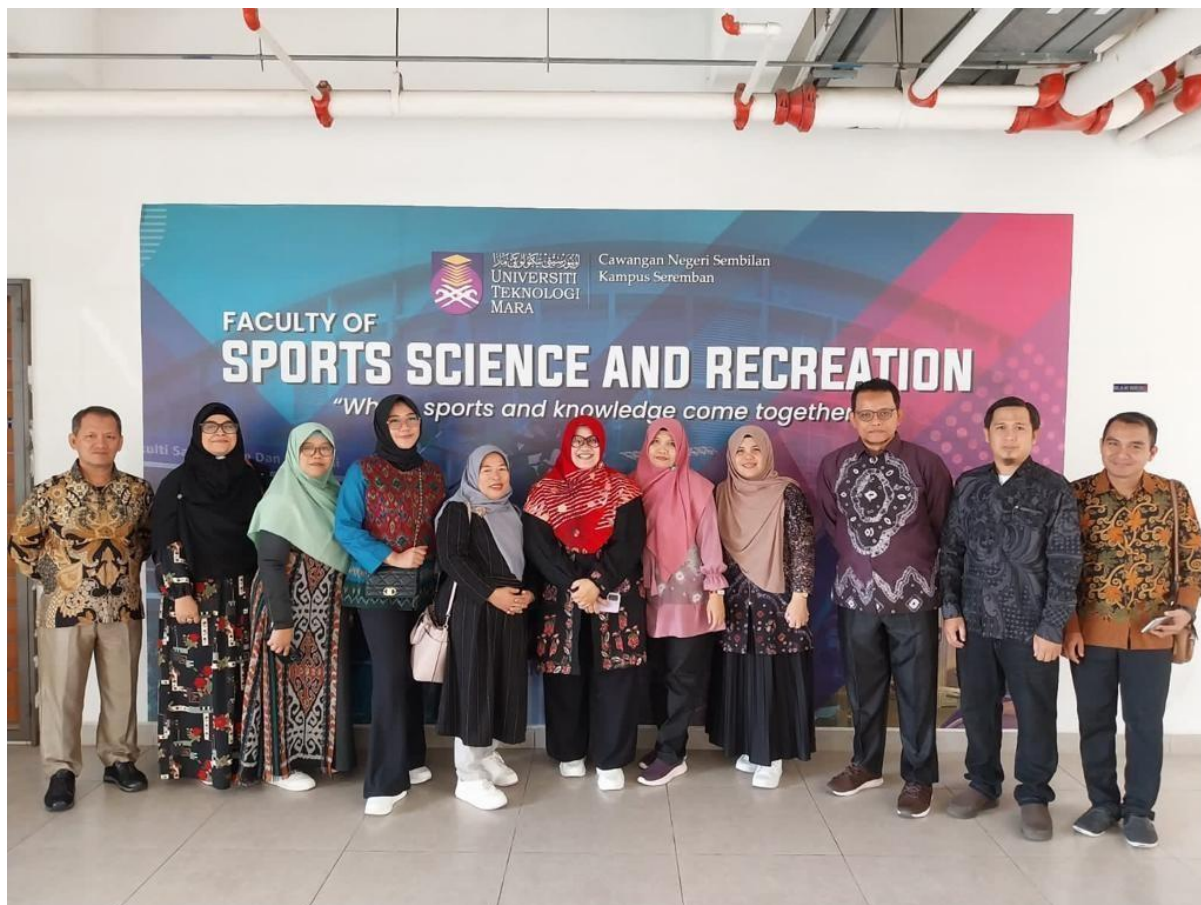
Delegasi UIN Raden Fatah Palembang di UITM Cawangan Negeri Sembilan, Malaysia